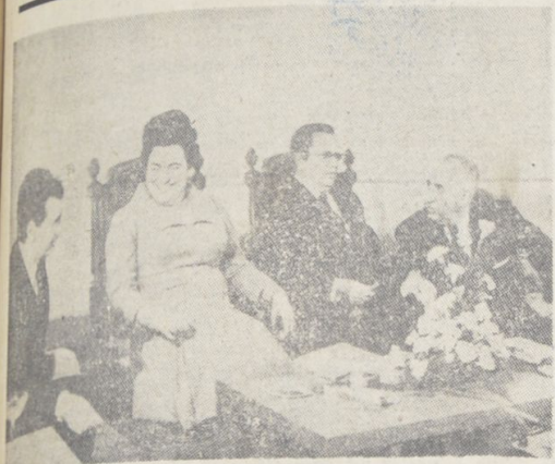
СВЕЧАНИ ПРИЈЕМ ПОВОДОМ ДАНА РЕПУБЛИКЕ. Председник Тито, Јованка Броз, Кири Глигоров и Цемал Биједић у разговору