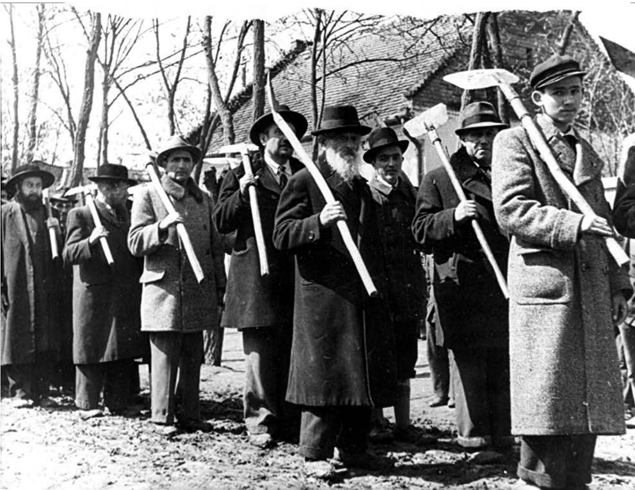
Odlazak na prinudni rad