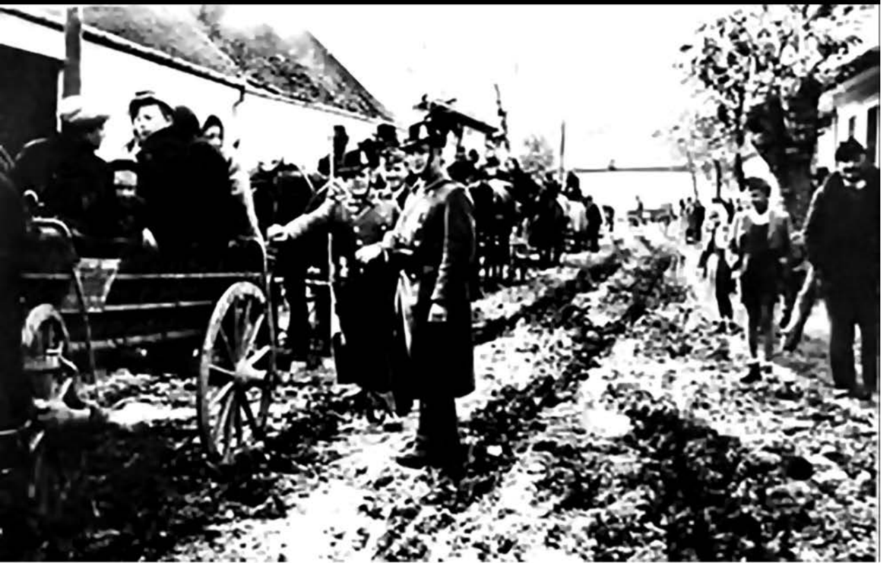
Deportacija bačkih Jevreja u sabirni logor