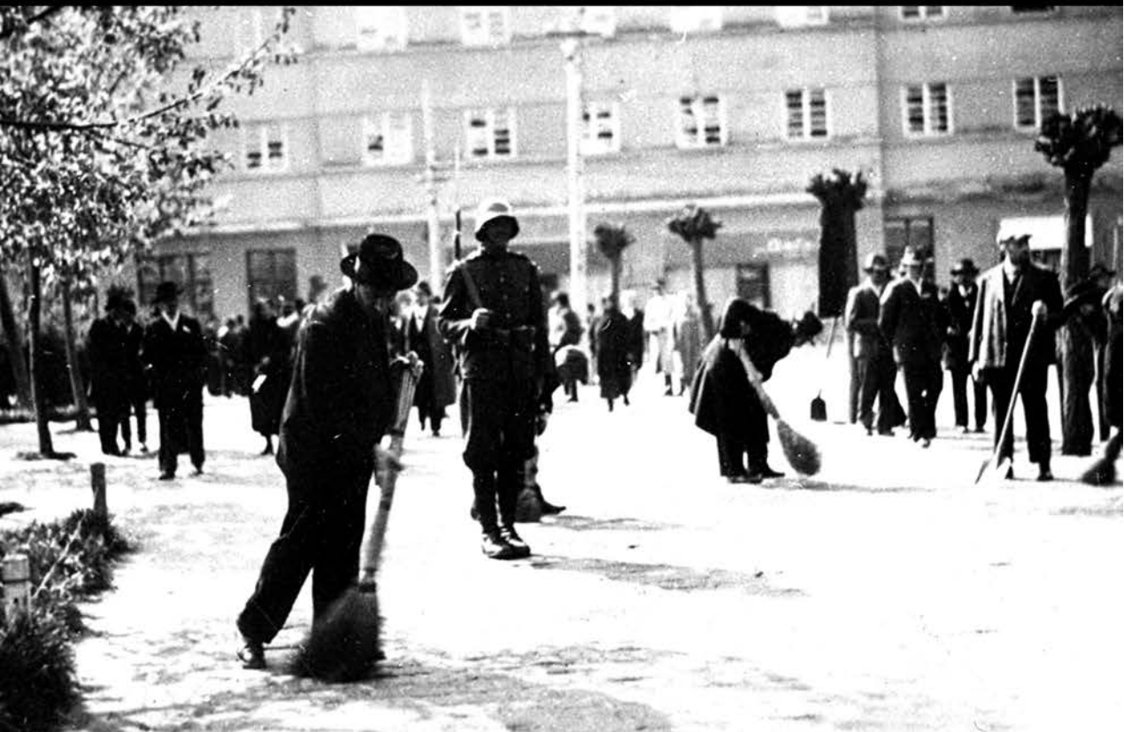
Jevreji u Senti za vreme mađarske okupacije ponižavani na prinudnom radu